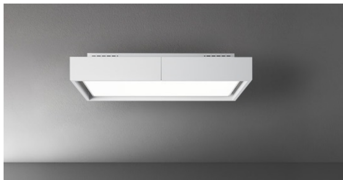
Poglądowe zdjęcie produktu

Sposób instalacji Sufitowy Wymiary 115 cm Wykończenie Silnik 600 m 3 /h Rodzaj sterowania Sterowanie elektroniczne Zakresy prędkości 4 Oświetlenie Led 50W (2700K - 5500K) Filtr węglowy Filtr Carbon.Zeo - wkład (w zestawie)